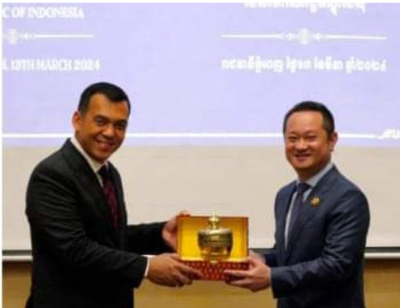
Dirjen Imigrasi Indonesia (Kiri) dan Dirjen Imigrasi Kamboja (Kanan).